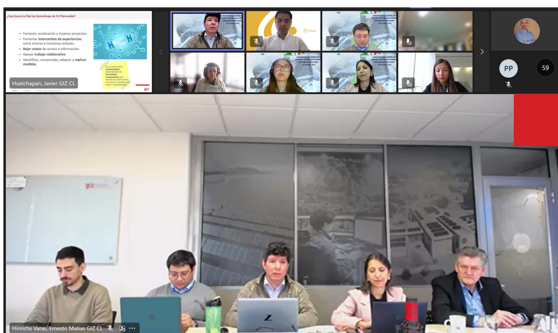
Reunión de la primera sesión de la red @GIZ.

Con la participación de 22 instituciones de cinco países de América Latina y el Caribe, este 30 de mayo se lanzó la primera Red de Aprendizaje de Hidrógeno Renovable.